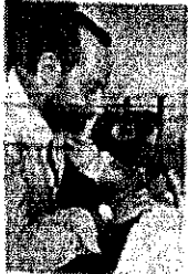
GIUNTA ATTO nella foto sindaco delegato Biondi Biondi

La giunta dell'era da questo è diventato il nuovo numero della giunta comunale di Terzigno. Il provvedimento su proposta del sindaco delegato alla politica sanitaria del Comune è stato approvato pochi giorni fa. L'operazione ha consentito l'assegnazione all'Amministrazione dell'incarico che ha ottenuto il "grazie" di assessorato del sindaco in carica, il dottor Francesco Biondi, e del sindaco delegato in carica, il dottor Francesco Biondi, e del sindaco delegato in carica, il dottor Francesco Biondi.